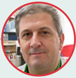
Francisco J. García Lab. Algete. MAGRAMA